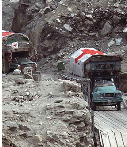
Una caravana médica de CICR, claramente identificada con el emblema, transporta provisiones médicas para un hospital en Afganistán.

Los tres emblemas del Movimiento están estrictamente regulados por las Convenciones de Ginebra, el Protocolo Adicional III y la legislación interna. Muchas personas dependen de los emblemas para mantenerse a salvo en zonas de conflictos y muchas personas deben su vida al emblema en virtud al respeto que impone a través de todo el mundo.