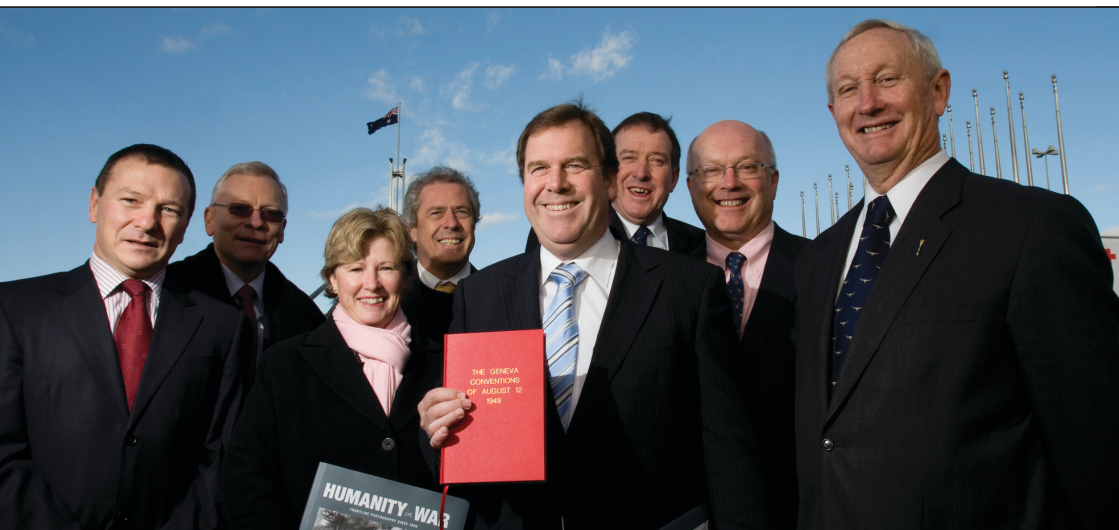
Reunión de parlamentarios con miembros del Movimiento de la Cruz Roja y la Media Luna Roja en el 60º aniversario de las Convenciones de Ginebra en Australia.